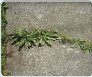
Onkruid op trottoir