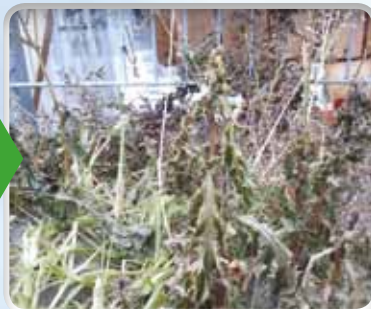
Distel 2 dagen na behandeling