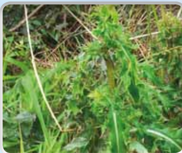
Distel vóór behandeling