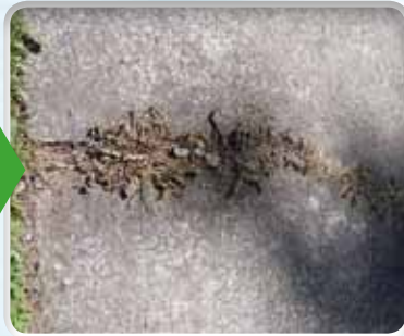
Onkruid op trottoir 2 dagen na behandeling