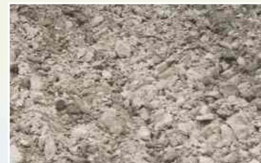
Voor de bewerking

Evers Agro B.V. Bedrijvenpark Twente 326 7602 KL Almelo T 0546 644866 F 0546 549912 E info@eversagro.nl www.eversagro.nl