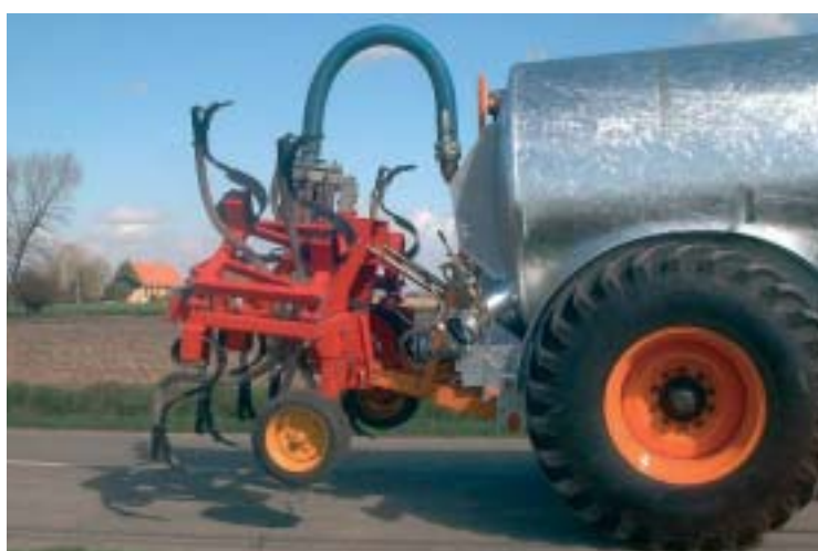
Vaste lift - Elévateur fixe