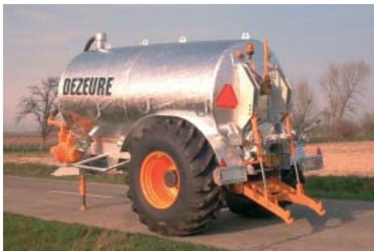
Lift met vaste hefarm