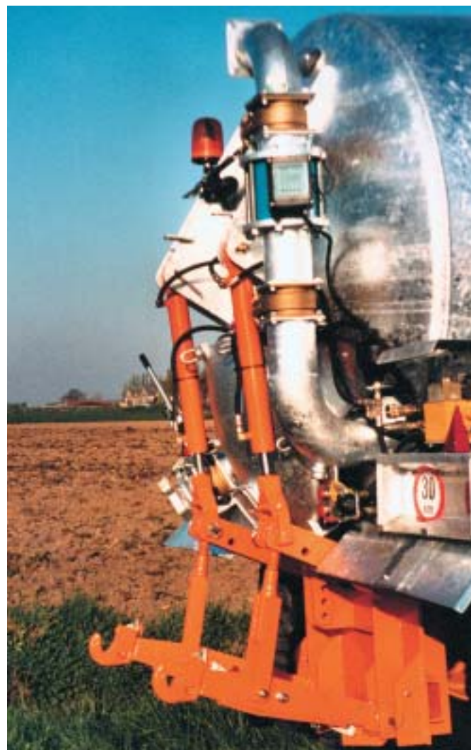
Lift met losse armen, debietregeling met Slurry 6" Elévateur, bras non-fixe, commande de débit avec Slurry 6"