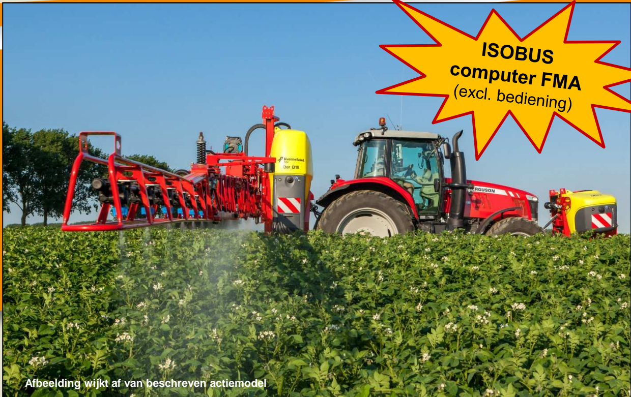
Afbeelding wijkt af van beschreven actiemodel